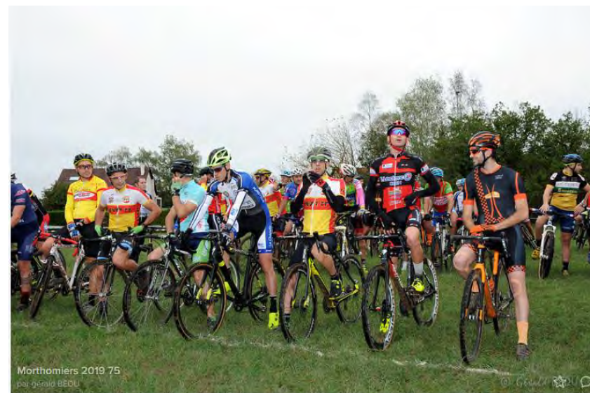
Morthomiers le 1 novembre