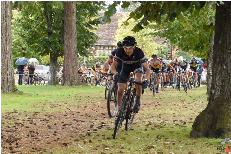
Brinon le 27 octobre