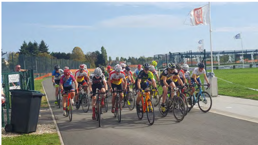
Châteauroux le 13 octobre