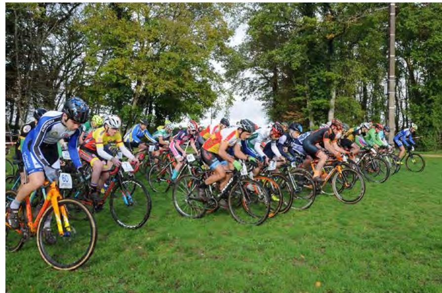
Levet le 3 novembre